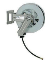
ZWIJAK system mobilny